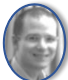
Ricardo Anaya Por México al Frente