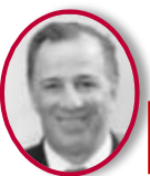
Jose Antonio Meade Todos por México