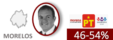
Cuauhtémoc Blanco Bravo Juntos Haremos Historia