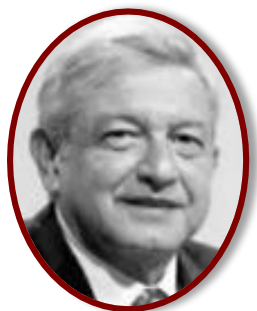
Andrés Manuel López Obrador Juntos Haremos Historia